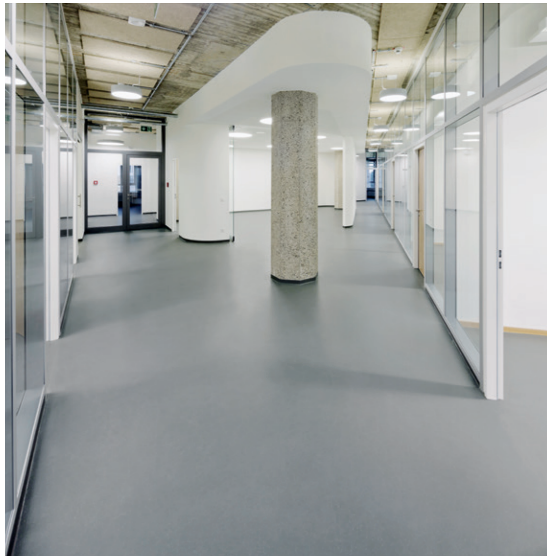
不伦瑞克工业大学, 德国

越简洁的设计, 越无惧时尚潮流的变迁。noraplan unita外观优雅, 至简至精: 典雅低调成就永恒的完美典范。