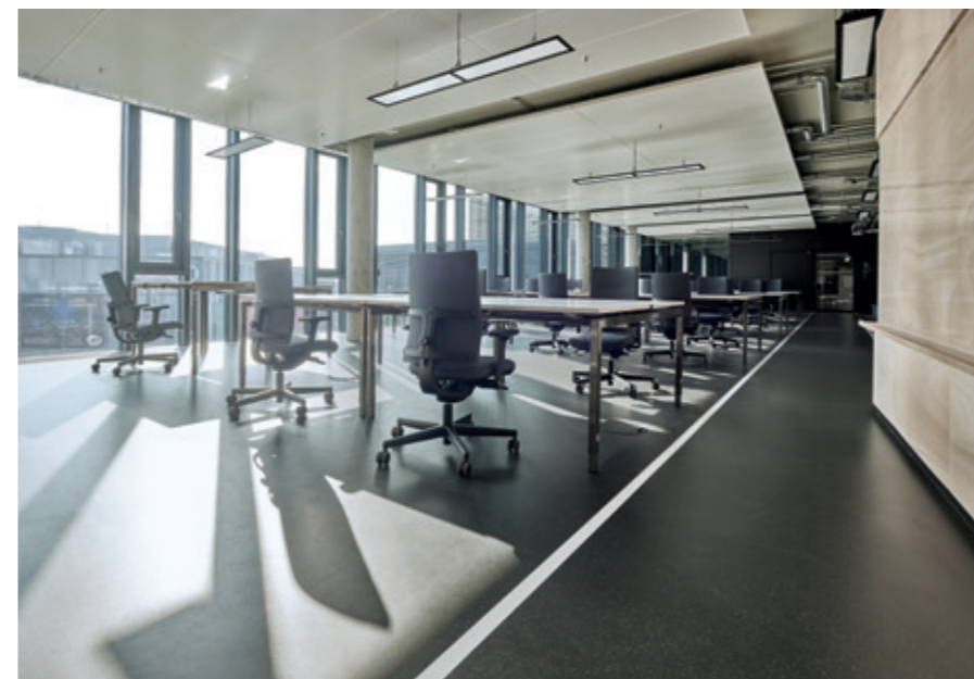
Zalando 总部, 柏林, 德国