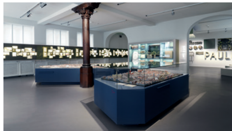
上图: “Boa Vista” 办公大楼中的开放空间办公室, 汉堡, 德国 左图: 汉堡历史博物馆, 德国