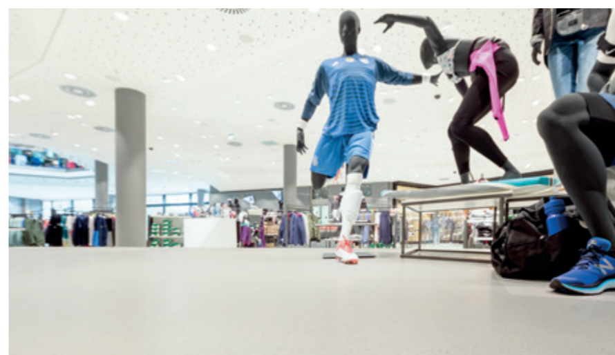
左图 © Dirk Wilhelmy | 上图: © Joachim Grothus