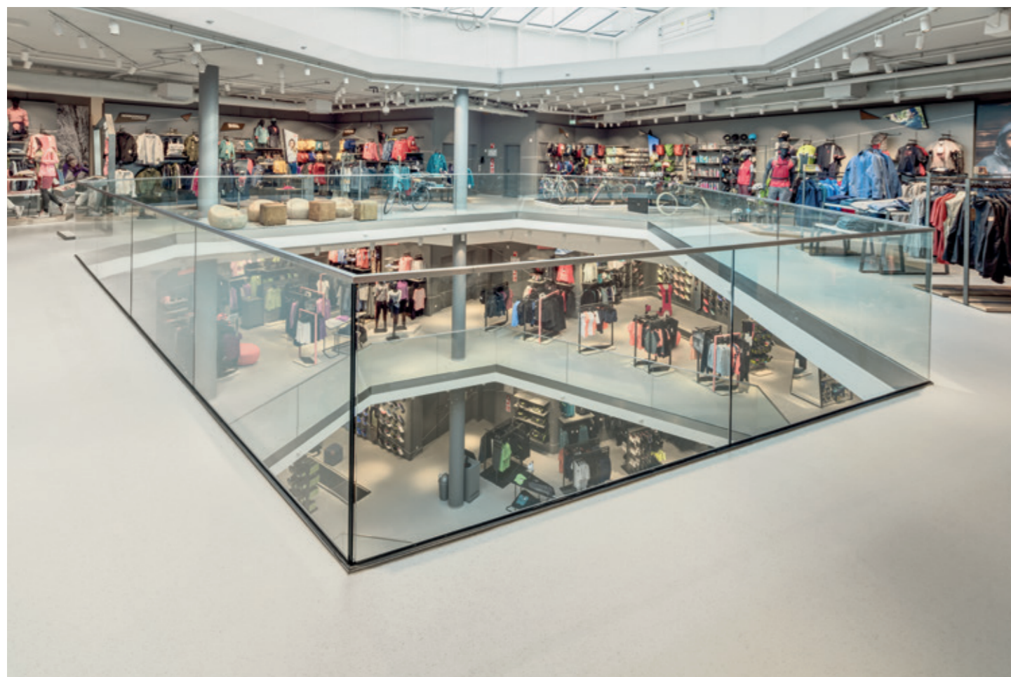
奥斯纳布吕克 L&T 体育商场, 德国

探索noraplan unita的闪光点。独特的橡胶地板让室内熠熠生辉，让人难以忘怀。花岗岩颗粒反射的微光，加强了室内空间的纵深感，让建筑焕发生机。