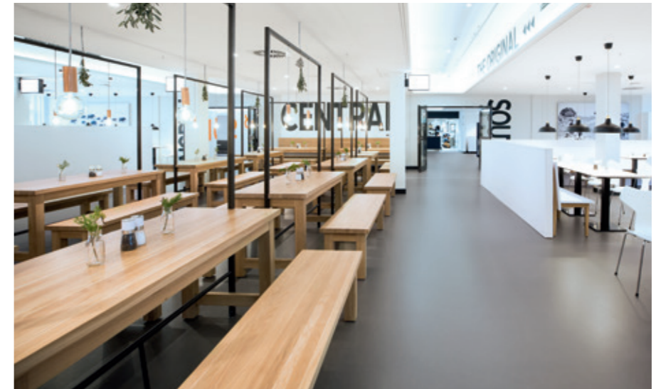
OTTO 餐厅 Kochwerk Elbe, 汉堡, 德国

noraplan unita 为您脚下的地板提供无限可能。从共享工作空间到博物馆, 从大学院校到餐厅, 其返璞归真的设计是现代建筑项目的完美之选。优雅的色彩系列有助于增强独特的室内氛围。