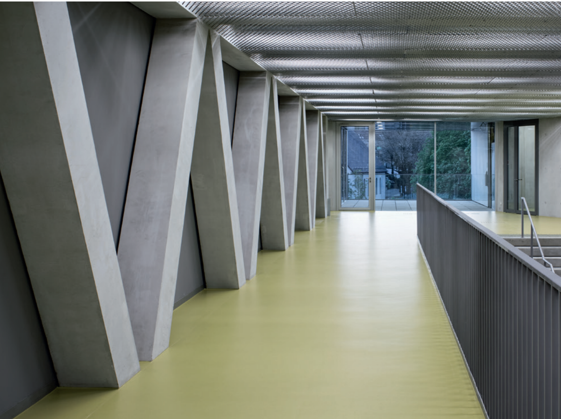
卡塞尔大学演讲厅和校园活动中心(HCC), 德国