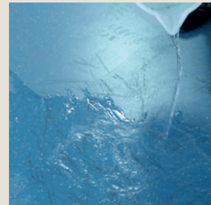
Répandre de l'eau.

Les pads de nettoyage des sols nora sont pourvus d'innombrables particules de diamants microscopiques. Le revêtement est nettoyé et lustré mécaniquement – uniquement avec de l'eau et sans le moindre produit chimique. Les pads nora® s'utilisent aussi bien pour l'entretien quotidien que pour la remise à neuf de revêtements extrêmement sales ou endommagés. Ils peuvent être employés avec la plupart des machines en vente dans le commerce et sont disponibles en différentes tailles. Les pads nora ont été développés exclusivement pour les revêtements de sol en caoutchouc norament® et noraplan®.