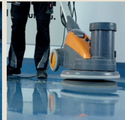
Nettoyer le revêtement avec des pads nora.