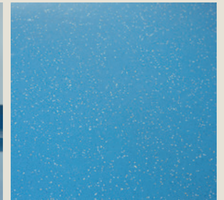
Un résultat parfait.