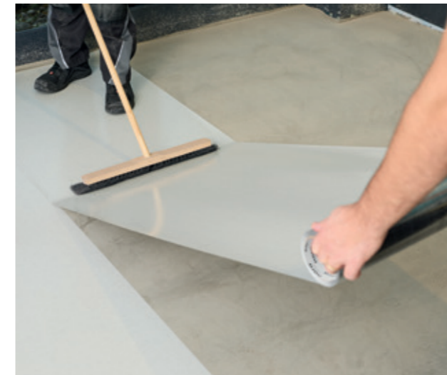
在基层地板铺设诺拉 Dryfix