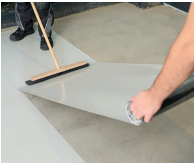
Poser nora dryfix ed sur le support