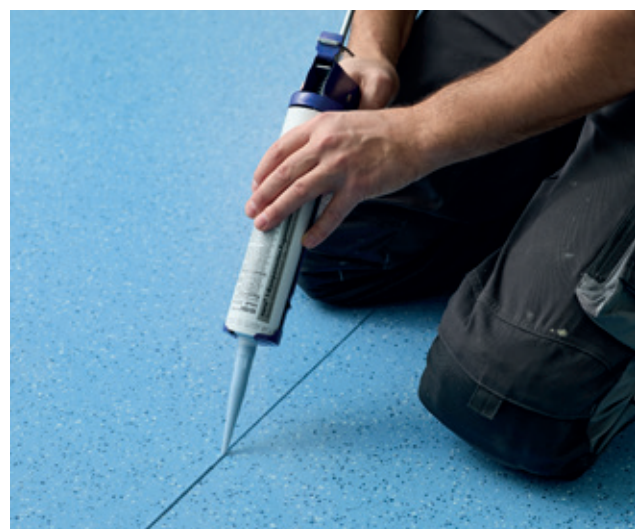
Sella el revestimiento de suelos