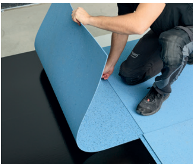
Instala el revestimiento de suelos