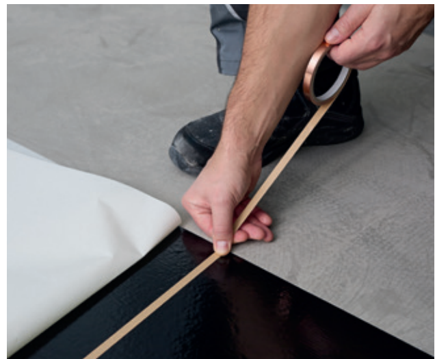
Adhiere la cinta de cobre