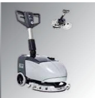
Autolaveuse Nilfisk SC351