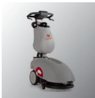
Autolaveuse Ecolab Vispa 35

Le nettoyage courant se fait avec des détergents neutres, manuellement ou mécaniquement. Dans certains locaux, afin de maîtriser les impacts environnementaux, le nettoyage se réalise avec une autolaveuse compacte équipée de pads (disques diamants) nora® n'utilisant que de l'eau sans aucun détergent chimique.