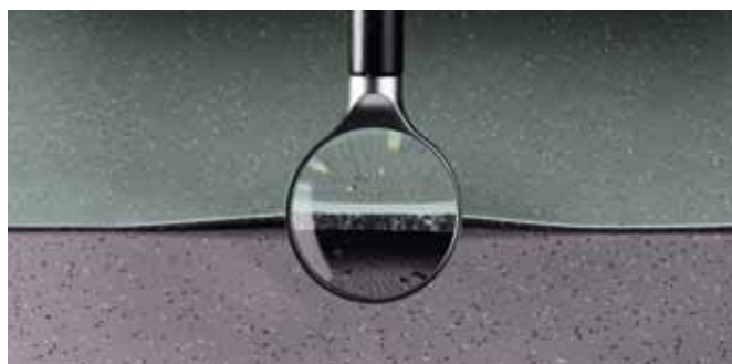
Sol acoustique avec sous-couche de mousse recyclée

Dans la plupart des locaux, notamment ceux qui concernent la petite enfance, les revêtements de sol nora® ne nécessitent pas de soudure des joints grâce à leur stabilité dimensionnelle dans le temps. Ainsi, les joints restent invisibles et ne sont pas sources d'encrassement ou de fragilité. L'absence de soudure permet également de réaliser des découpes en utilisant différents coloris pour créer des formes.